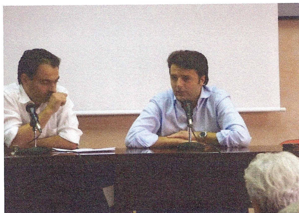
Matteo Renzi risponde alle domande di Alberto Campaioli