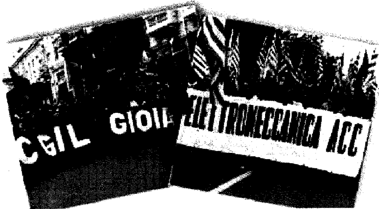
Spaccati anche sulla casa Due posizioni ben distinte per Cgil e Cisl sul decreto legge annunciato dal governo

Bandiere al vento Il decreto legge Berlusconi minaccia di allargare la spaccatura, già aperta dal "contratto separato". E la contrapposizione cresce